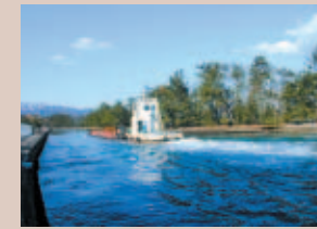
⑥ 天橋立運河：有名な廻旋橋がかかるこの運河はニッケル鉱石運搬船が行き交います。