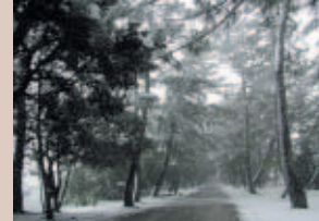
③ 雪景色の松並木：冬の天橋立は常緑樹の松の緑と白い雪のコントラストが美しいです。