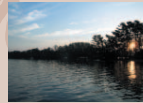
⑤ 松並木越しの朝日：早朝の空気は澄んでいてとても気持ちが良いです。