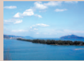
① 桜山：ビューランドのある玄妙山に対して西の桜山と呼ばれた、おすすめの穴場です。

天橋立(文珠地区)にはあまり知られていない観光スポットがまだまだあります。のんびり散策しながら自分だけのスポットを探してみたいか…。