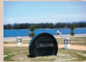
② 文珠浜公園：天橋立を真横から間近に楽しんでいただけます。芝生の広場には遊具もあります。