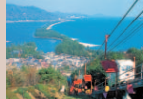
④ 天橋立ビューランド：ここから見下ろす天橋立「飛龍観」はまさに絶景。