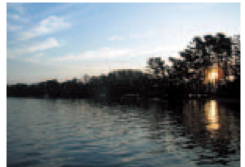
③ 松並木越しの朝日：早朝の空気は澄んでいてとても気持ちが良いです。