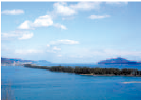
① 桜山：ビューランドのある玄妙山に対して西の桜山と呼ばれた、おすすめの穴場です。