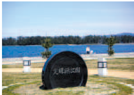
② 文珠浜公園：天橋立を真横から間近に楽しんでいただけます。芝生の広場には遊具もあります。