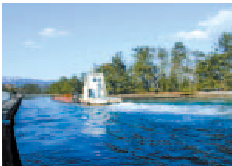
④ 天橋立運河：有名な廻旋橋がかかるこの運河はニッケル鉱石運搬船が行き交います。